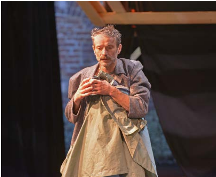
Répétitions juin 2021