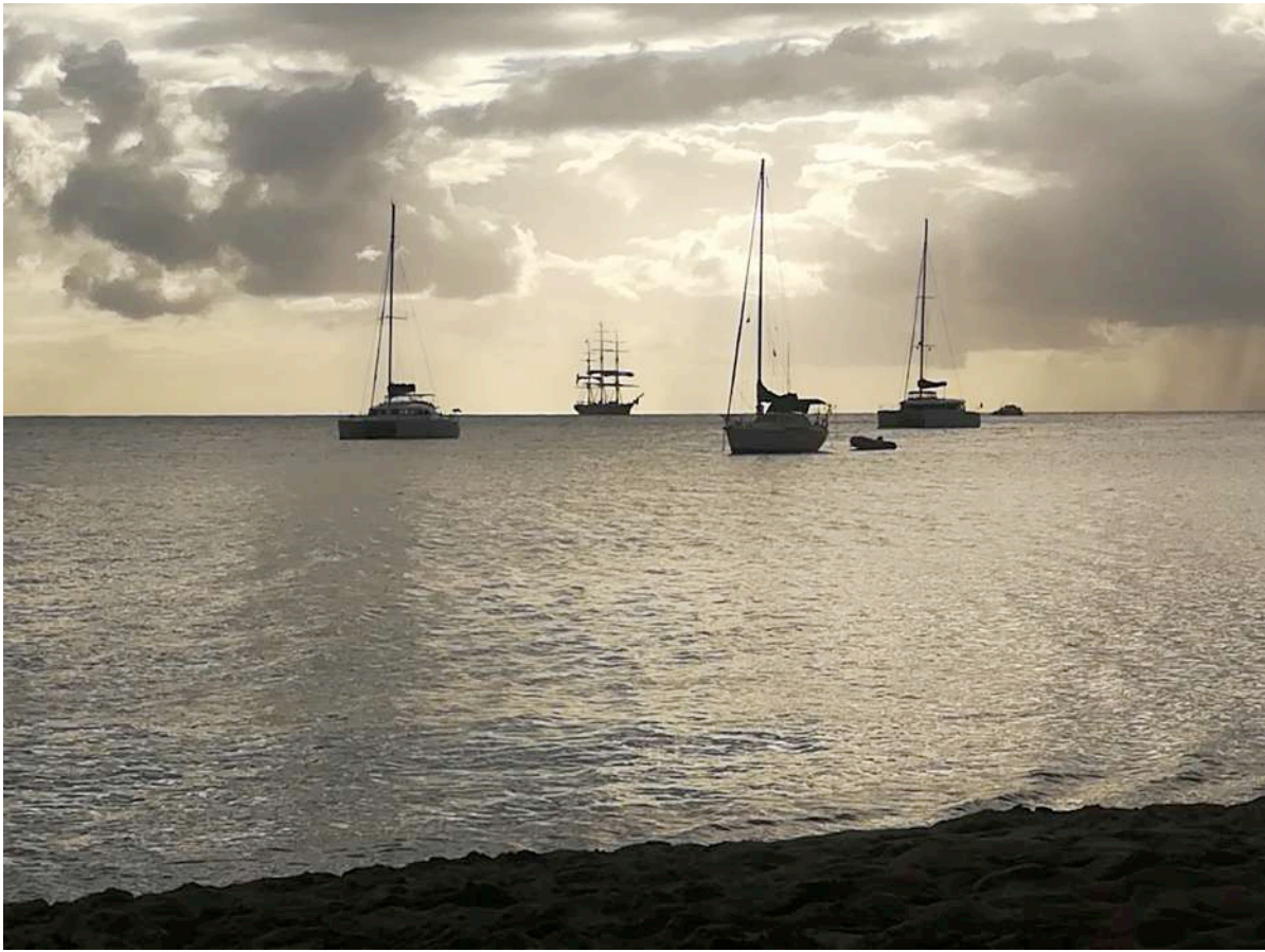
Photo prise en janvier 2019 en Martinique, Grande Anse d'Arlet.

Lors de repérages effectués en hiver 2019 en Martinique, marchant sur une plage j'aperçois une rangée d'une bonne vingtaine de transats qui n'étaient pas là un jour plus tôt. Sur ces transats des touristes hollandais. Et sur les transats sans touristes je peux lire sur le tissu : « Stad Amsterdam », ville d'Amsterdam. Je tourne la tête vers la mer et soudain je l'aperçois, à l'horizon, le trois mâts. Stad Amsterdam, c'est son nom.