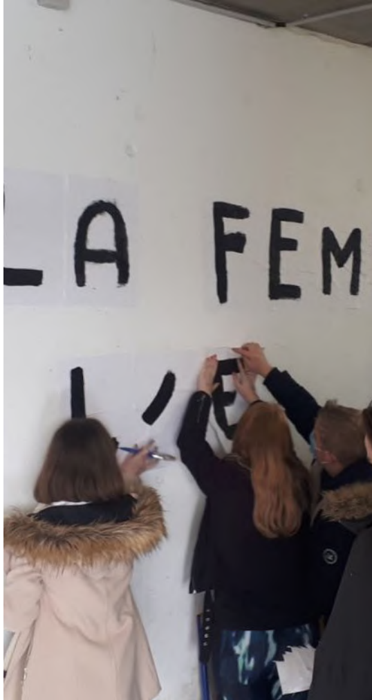
Séance de collage avec les collégien.nes du collège Gabriel de Montgomery de Ducey-les-chéris