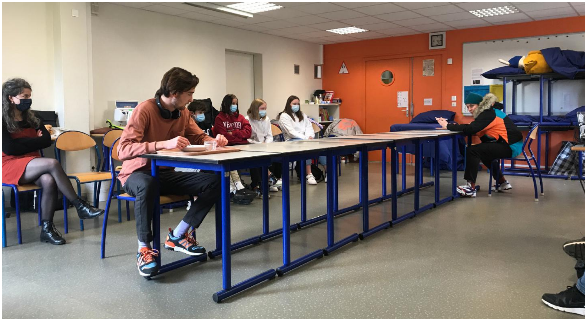
Répétition publique au collège Tancrede de Hauteville de Saint Sauveur Lendelin