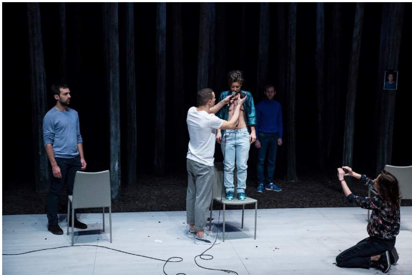
Ogres – première à la Chartreuse Cnes de Villeneuve lez Avignon – janvier 2017