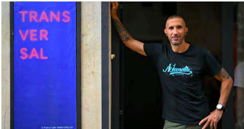
L'artiste français Redwane Rajel pose pour une séance photo lors du 78e Festival d'Avignon, le 29 juin 2024

AFP, le 07/07/2024 à 05:00 Modifié le 07/07/2024 à 10:44