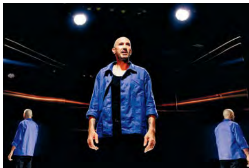
À l'ombre du réverbère À partir du 18 novembre, au Théâtre Paris-Villette.

De Molière, mise en scène de Clément Poirée. Durée: 2h20. Jusqu'au 23 nov., 20h (du mar. au sam.), 16h (dim.), Cartoucherie, Théâtre de la Tempête, route du Champ-de-Manœuvre, 12 e , 01 43 28 36 36. (8-24€). TTT Jolie idée que de demander en amont à chaque spectateur d'apporter un objet