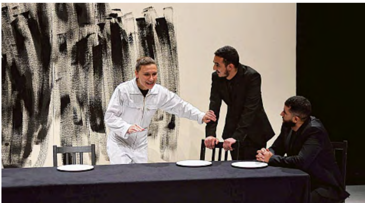
Il y a quelques jours, les détenus du Pontet ont joué au lycée à Mistral la pièce de Federico Garcia Lorca "La casa de Bernarda Alba".

Dès 2004, un partenariat et des actions ont été mis en place entre le Festival d'Avignon, le Centre péniten-