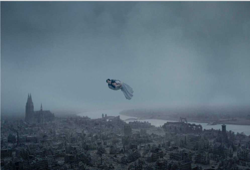
Pour l'Eternité, Roy Anderson

« La Joconde c'est la grâce, c'est un sourire éphémère. C'est ce sourire de la grâce qui fait l'union avec le chaos du paysage qui est derrière. Son sourire forme un pont d'un côté à l'autre. Du chaos on passe à la grâce et de la grâce on repassera au chaos. »