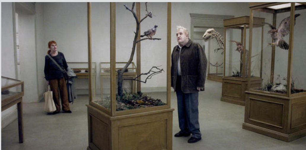
Un pigeon perché sur une branche philosophait sur l'existence, Roy Anderson

Hors du temps, le cycle des répétitions historiques, tragiques et intimes, cesse. C'est grâce à ce suspens que ces errants, borders, voyous, faiseurs d'histoires, solitaires, campés à la périphérie d'un monde, sur une île vouée à disparaître, vont réenclencher un mouvement salvateur.