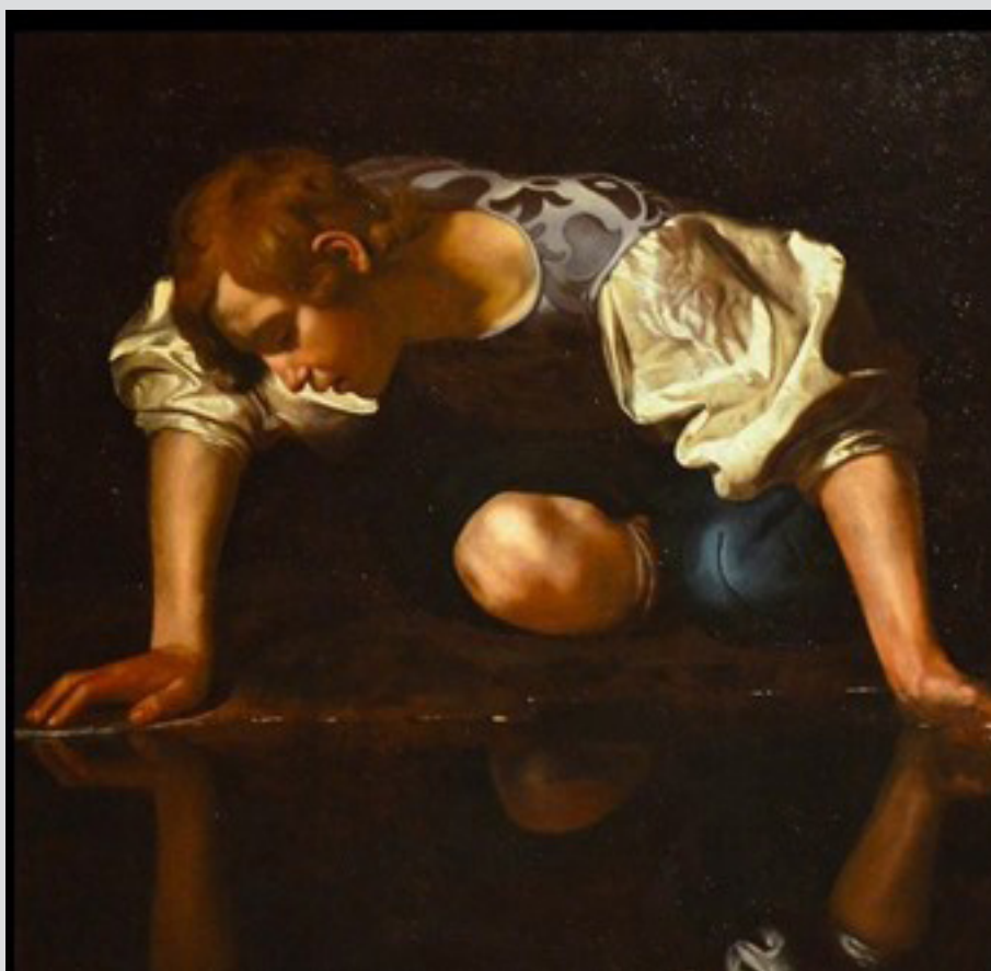
Narcisse, Le Caravage