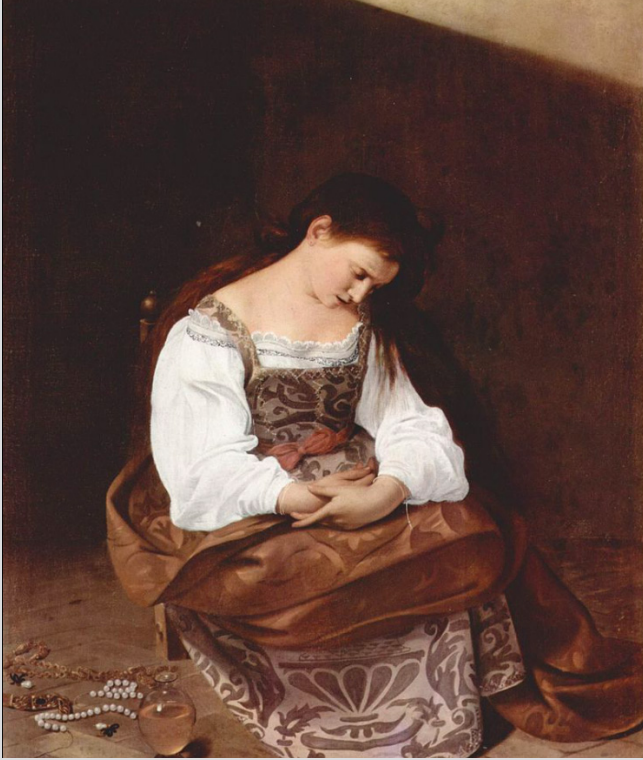
La madeleine repantante, Le Caravage