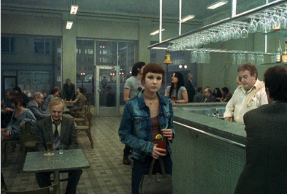
Nous, les vivants, Roy Anderson