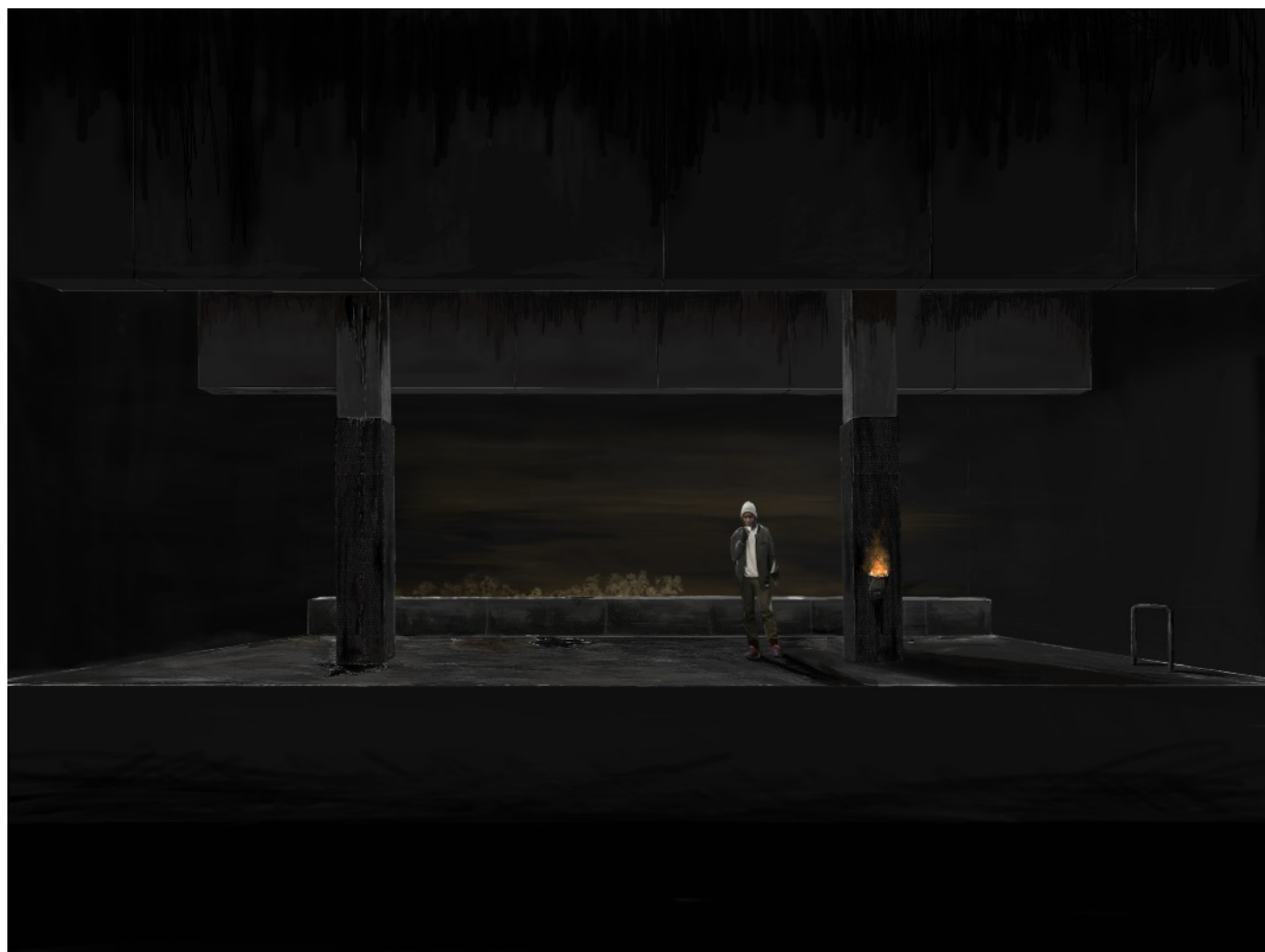
Scénographie de Nicolas Marie

Comme une station de métro peinte par Pierre Soulages.